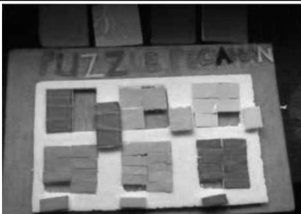
Gambar 1 Media puzzle